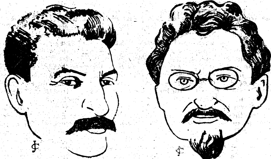
He aquí los dos verdugos de la pobre Rusia, cada uno lleva sobre su conciencia e peso de miles de asesinatos

CAPE BAR RESTAURANT en Toledo, por enfermedad del dueño. Razón: Plaza Barrio Rey, 2, 4 y 6. TOLEDO