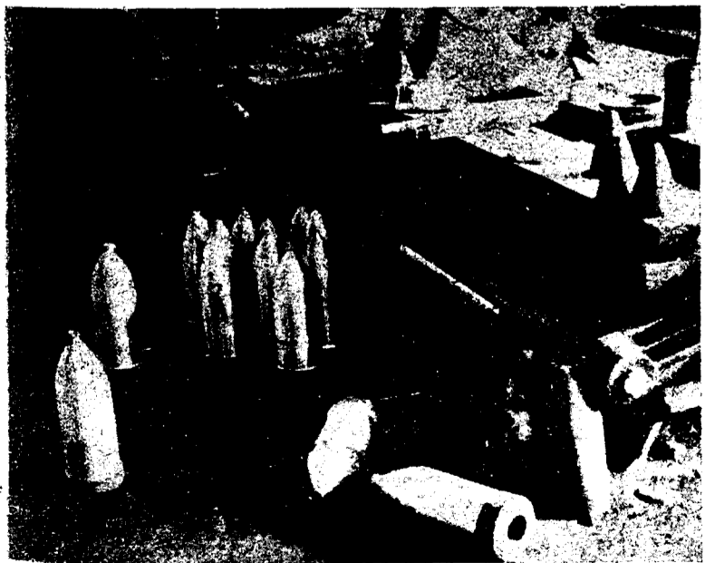
Cuando nuestras fuerzas ocuparon la Constructora Naval de Reinosa, encontraron la fábrica en plena producción. He aquí una máquina de desbaste, y junto a ella varias granadas de cañón de tipo extranjero.

Se nos anuncia que en breve plazo asistiremos a una gran campaña de propaganda roja. Radio Rabat se