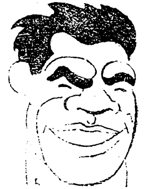
Paulino Uzcudum sigue colaborando por España; a beneficio de ésta celebrará varios encuentros en algunas capitales; con este fin ha llegado días pasados a Sevilla.