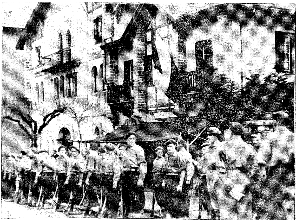
Los inimitables Requetés navarros, conservadores de la España tradicional, alto exponente de la virilidad española, salvadores del movimiento en críticos momentos, van abriendo, con la pujanza de sus pechos fornidos las fronteras de la Patria. Con Navarra, cuyo alzamiento uránico es único en la historia, están en deuda las demás regiones españolas. La España tradicional se ha salvado por ellos, y por ellos va siendo Navarra y tradicionalista toda la España liberada. Hé'os aquí junto a una de las casas de la carlista Durango, alegres, optimistas, sanos de cuerpo y de espíritu, como si sus hazañas no fueran épicas y como si tras ellos no fueran prendidas las miradas de todos los españoles.