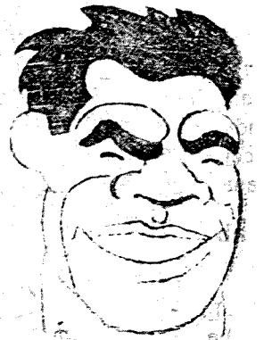
Paulino Uzcudum sigue colaborando por España; a beneficio de ésta celebrará varios encuentros en algunas capitales; con este fin ha llegado días pasados a Sevilla.