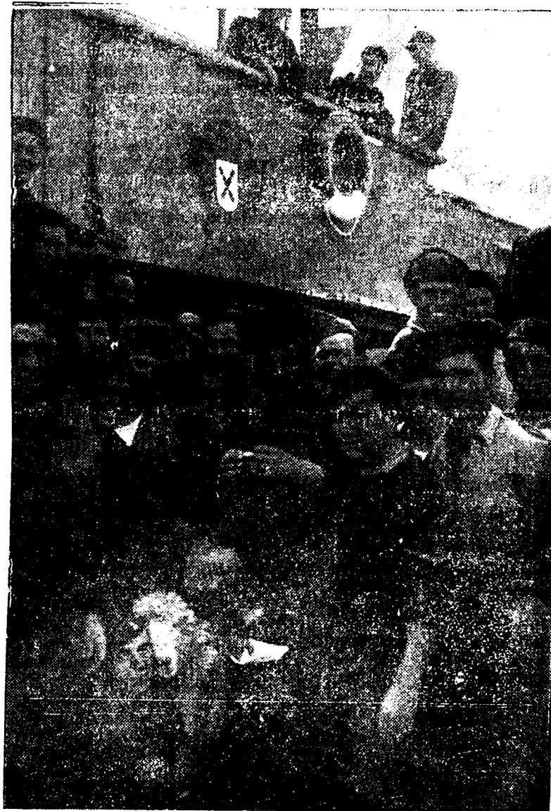
El “Balears”, nuestro magnífico buque nacional, prestigia en las operaciones navales la cruz de Borgoña. En la Marina, como en el Ejército, los requetés hacen gala de su heroico patriotismo y de la eficiencia de sus actividades al servicio de la Patria

Hoy he tenido ocasión de hablar con lord Aldwyn, de la Cámara de los Lores, y con el periodista inglés Kélnarch, los cuales declaran que ésta es la segunda visita que hacen a España a partir del movimiento nacional. Dicen que han tenido también ocasión de visitar la zona dominada por los rojos y que contrastan fuertemente el sentido de vida de ambas partes. Lord Aldwyn dice que quiere hacer resaltar cuatro puntos: el primero, que ha observado en cada región la calma más absoluta, como asimismo un exacto cumplimiento de la ley, tanto en los ciudadanos como en las tropas que vienen a descansar del frente; también quiero hacer notar la rapidez de los servicios de todas clases en las ciudades conquistadas, que los rojos abandonan destrozadas; asimismo me admira el valor con que los españoles han sostenido sus valores históricos y su permanencia en la fe que siempre mantuvieron; por último manifiesta que quiere hacer constar su agradecimiento a las autoridades españolas por el hidalgo trato que les han dispensado.