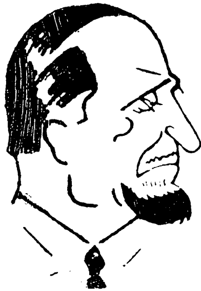
GRANDI, el delegado italiano en el Comité de No Intervención, cuya actuación serena y enérgica ha hecho posible un acuerdo que ponga fin a la solución del conflicto, además de obligar al delegado soviético a deponer su actitud marcadamente intransigente y hostil.

El ilustre prelado permaneció hoy en Sevilla, y mañana irá a Salamanca con objeto de visitar al Generalísimo y darle cuenta de este feliz viaje, que ha sido un recorrido triunfal para la España de Franco.