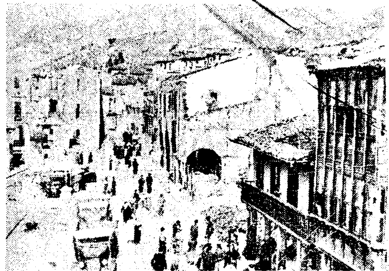
Potes, la señorial villa santanderina, sufrió los latigazos de la dinamita marxista. Véase un aspecto lamentable de la bella ciudad.

Las brigadas de zapadores trabajaban intensamente en la fortificación de las nuevas rectificaciones, que las hemos conseguido a punta de bayoneta, después de una tarea agobiadora e incansable por parte de aquellos animosos muchachos, que se han batido sin interrupción, algunas veces, durante las veinticuatro horas del día. Como el enemigo quisiera interrumpir aquellos trabajos, abandonaron el pico, y parapetados en las construcciones a las que estaban dedicados, respondieron enérgicamente a la agresión, rechazándola con bravo empuje y manteniendo la guardia en las mismas, relevando más tarde a todos los soldados, para que pudieran descansar después de tan continuos ataques.