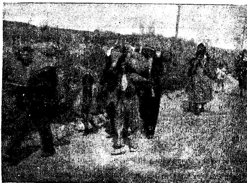
MALAGA.—Aún siguen llegando a la capital nutridos grupos de gente humilde que huyeron antes de la llegada de nuestras tropas. Parece que van con miedo. ¡Tántas cosas le han dicho! Pronto se convencerán de la verdad: la paz y la justicia de nuestro campo

Añade que la población de Madrid está viviendo unos momentos de gran angustia, ya que ve el decaído espíritu de los milicianos y que estos mismos no se recatan de decir que la situación está imposible para ellos.