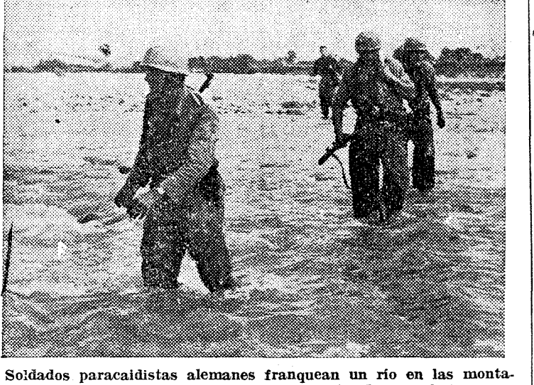
Soldados paracaidistas alemanes franquean un río en las montañas de los Abruzzos, en Italia.

BERLIN, 28.—Comunicado oficial: "Italia del Sur: En el sector occidental sólo se registraron ayer combates de importancia local. Después de un duro combate contra fuerzas enemigas, muy superiores en número, nuestras fuerzas abandonaron una altura situada al norte de Venafro. En el sector de Ortona, y después de haber infligido al enemigo muy elevadas pérdidas en hombres y material durante los duros combates librados estos últimos días, nuestras tropas han evacuado las ruinas de Ortona, ocupando nuevas posiciones al noroeste de la ciudad, muy próximas a ella".—EPE.