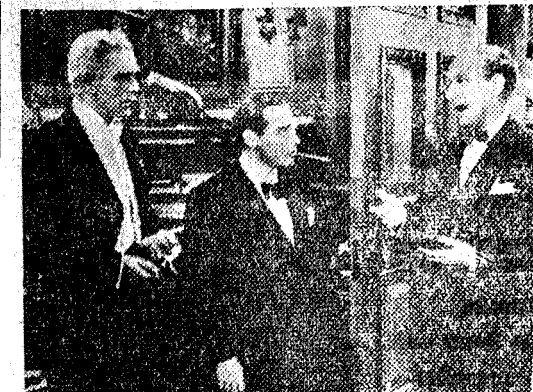
Jack Conway, director de "Mi marido está loco"