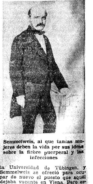
Semmelweis, al que tantas mujeres deben la vida por sus ideas sobre la fiebre puerperal y las infecciones

El 50 por 100, hallado apto para servicio activo