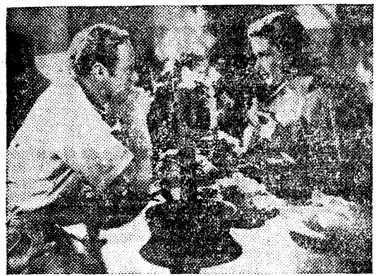
Leslie Howard con Ingrid en "Intermezzo", magnífica película de Chamartín que ha tenido un grandioso éxito en su estreno ayer en el cine Avenida