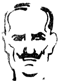
Santa María de la Cabeza.

Acudí a ese acto, porque me creía obligado a tomar parte en él. Yo no creí debía hablar, después de esos señores, pero así, tuve que hacerlo.