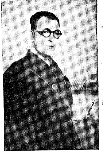
EL JEFE PROVINCIAL.

Los soldados que lo habían traído y cuantos se hallaban a su alrededor permanecían en actitud respetuosa ante el general; éste, con acento bondadoso ordenó: