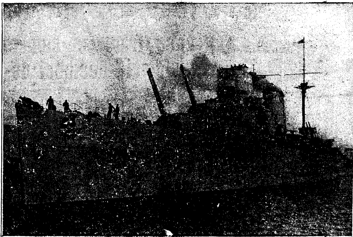
El gran crucero nacional «Canarias», terror de los barcos piratas del «gobierno» de Valencia, que acaba de apresar en el Mediterráneo un importante cargamento rojo de armas y municiones

Es tremendamente criminal la obstinación del Gobierno y el Mando marxista en exigir a sus masas tan enormes sacrificios, a sabiendas de! poderío del Ejército nacional y del triunfo definitivo que le corresponde por su gran heroísmo y por la gran justicia de su noble y santa causa.