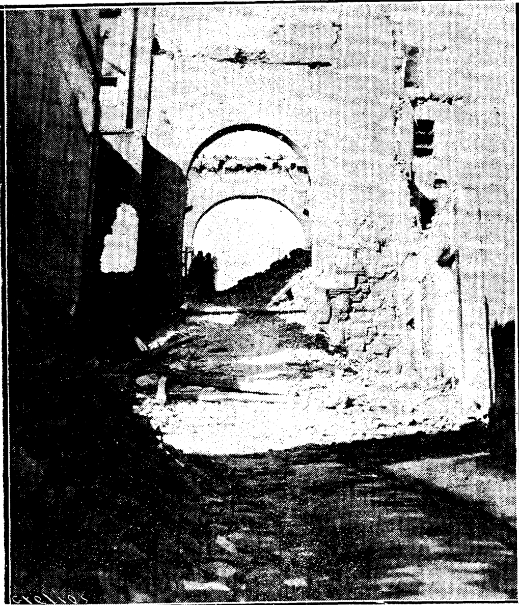
El reverso del Arco de la Sangre, después del dominio rojo. En ruinas uno de los rincones más típicos de Toledo. Del célebre Mesón del Sevillano, que era su mayor gala, sólo el solar... Lo que habían respetado cerca de cuatro siglos españoles, lo arrancaron dos meses de Anti-España

El diputado socialista ha aconsejado a sus camaradas catalanes que pidan en una próxima reunión secreta del grupo socialista, el envío urgente de armas y municiones para el Frente Popular. Este material de guerra podría ser suministrado en parte por las ventas de material caducado del Ejército y también por una parte del material nuevo que los peritos se encargarían de declarar defectuoso en el momento de la recepción. Por otra parte, el diputado tomará la palabra en la tribuna de la Cámara, para pedir al Gobierno de M. Blum la estricta aplicación de todas las cláusulas del Tratado de Algeciras para todo lo que concierne a las cuestiones del Mediterráneo y del Marruecos español.»