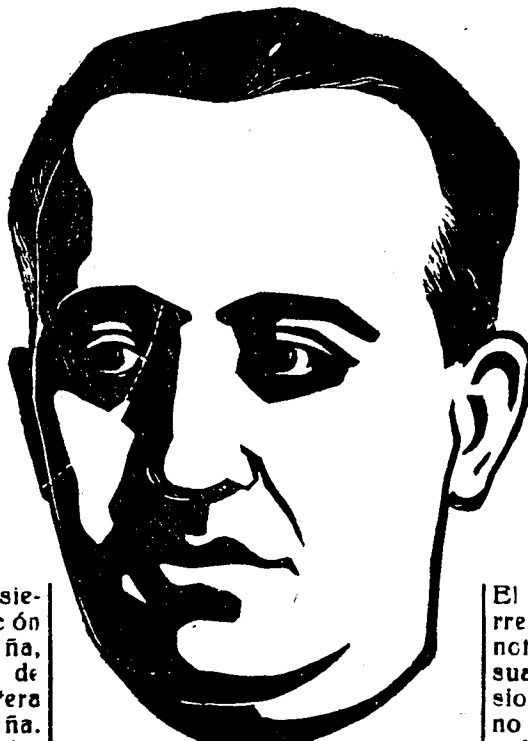
¡FRANCO y cierra España!

Ya desde Torrelavega a Laredo, las fuerzas del General Franco han puesto a la capital montañesa un estrecho círculo que, al apretarse por momentos, acabará con la estrangulación total de las fuerzas que defienden la capital de la Montaña.