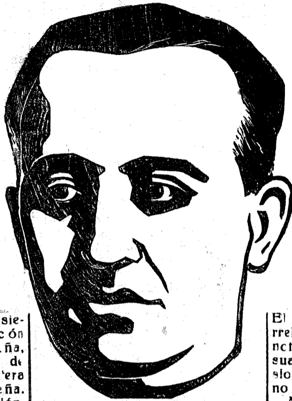
¡FRANCO y cierra España!

Ya desde Torrelavega a Laredo, las fuerzas del General Franco han puesto a la capital montañesa un estrecho círculo que, al apretarse por momentos, acabará con la estrangulación total de las fuerzas que aún defienden la capital de la Montaña.