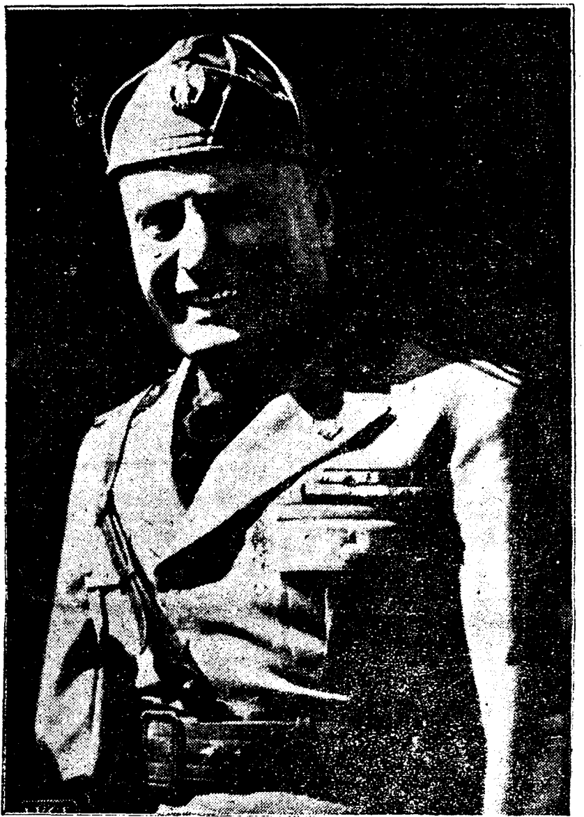
Benito Mussolini, el Duce, el gran forjador del Imperio Italiano, que ha salido para Alemania, donde se celebrará con Hitler una entrevista histórica.