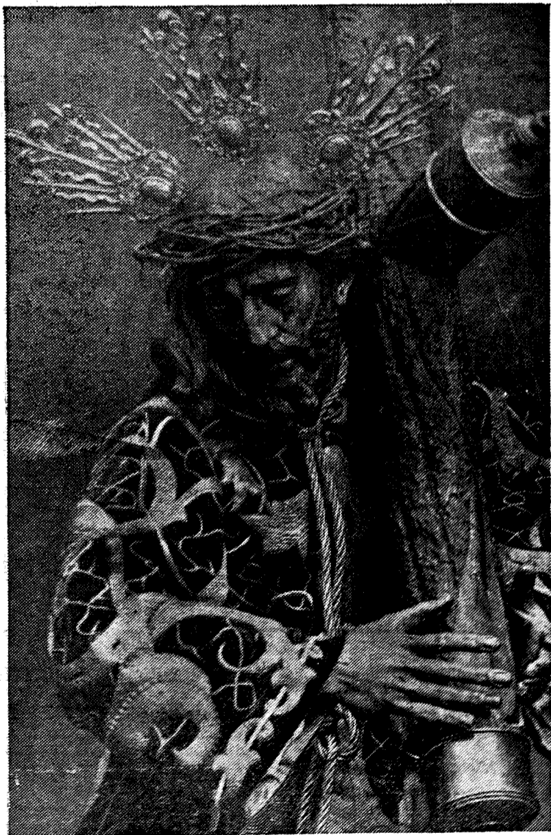
Este Nuestro Padre Jesús con la cruz al hombro, de la Cofradía del Valle, de Sevilla. Sale en la noche del Jueves Santo por las calles. El peso de su cruz quiere compartirlo hoy España, que volverá a ser para siempre su cirineo.

Plaza del Generalísimo Franco Talavera de la Reina