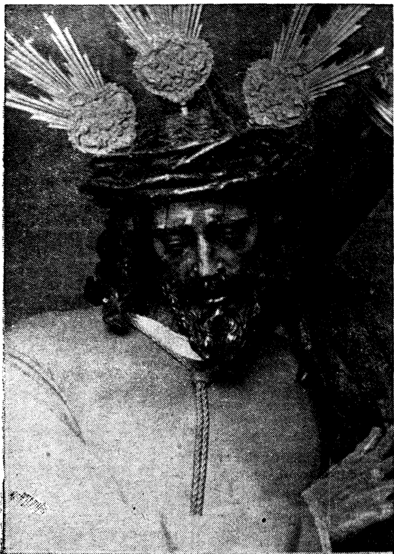
Jesús de la Pasión. Montañés, en su soberbia escultura, cinceló en el rostro de Jesús los martirios de su pasión. Sevilla en esta madrugada del Jueves Santo, por sus calles elevará la oración de España