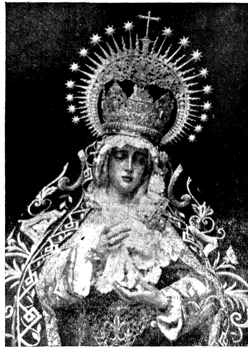
Nuestra Señora del Valle, una de las imágenes más bellas de la Semana Santa sevillana, que se está celebrando este año con todo esplendor y con el recogimiento y la piedad del pueblo sevillano

Ossorio Bigardo, el del truco de la juridicidad. Muy amante del Derecho; pero muy amigo de los rojos, que siempre lo han atropellado, y ahora lo pisotean como caballerías, o más bien, como fieras. Muy católico; pero estrechamente aliado con los canalicos asesinos de sacerdotes y frenéticos incendiarios de templos. Un inmenso fresco. Es de los de «una vela a Dios y otra al diablo». Su aptitud para la farsa es tan grande como su estómago; su capacidad de desvergüenza, tan voluminosa como su vientre.