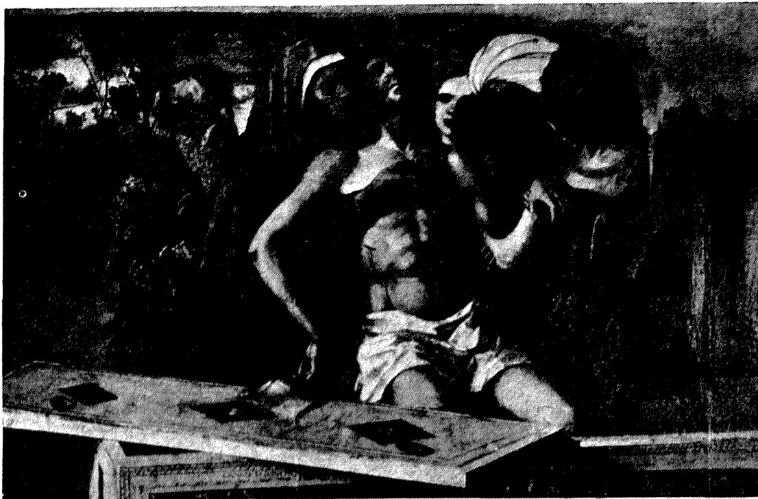
Señor: nuevos sicarios, no conformes con crucificarte, han querido enterrarte en el sepulcro de tus pasiones sin nombre. Y Tú, Señor, has muerto con las tinieblas de una guerra que todos padecemos porque «todos en Tí pusimos nuestras manos». Pero lo que «ellos» ignoraban, y es nuestro consuelo, es saber que tras el viernes de Pasión viene el sábado de Gloria con clarines de resurrección triunfa'.