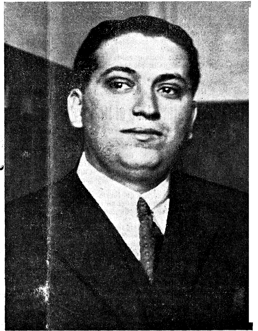
DON JOSE CALVO SOTELO el ilustre hombre público español, protomártir del Movimiento Nacional, en cuyo honor se ha celebrado un solemnisimo acto en San Sebastián con la Intervención de eminentes personalidades (Extensa información en 6ª página)