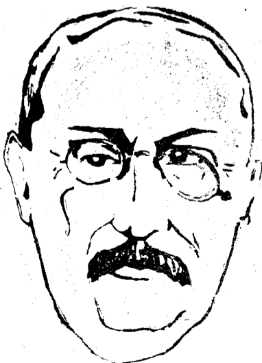
Crisis de Blum: ¡Se ha roto el cinturón del Frente Popular Francés!...

A las 3 de la madrugada, acudió al Palacio del Eliseo a presentar la dimisión colectiva. Hizo después unas declaraciones: El Gobierno, después de una detenida deliberación decidió entregar los poderes al presidente de la República. El examen del escrutinio de la contraposición del señor León Perrier, no dejaba esperanza de que pudiera ser aprobada la fórmula conciliatoria elaborada por la delegación de las izquierdas y que no descontentaba al gobierno. Privados de los medios indispensables para llevar a cabo la obra de saneamiento nacional, nos vamos. Pero antes quiero hacer constar dos cosas: Nuestro más afectuoso agradecimiento a la mayoría de la Cámara y a nuestros amigos del Senado y además nos dirigimos a cuantos se han puesto a nuestro lado, a cuantos se han reunido en el Frente Popular para que conserven la plenitud de su calma, de su sangre fría. Es necesario que la transmisión de poderes se verifique constitucionalmente, legalmente, pacíficamente. Espero que esta sea una prueba más de la confianza que en mí han puesto. Se encargó de formar Gobierno Chanpeps.