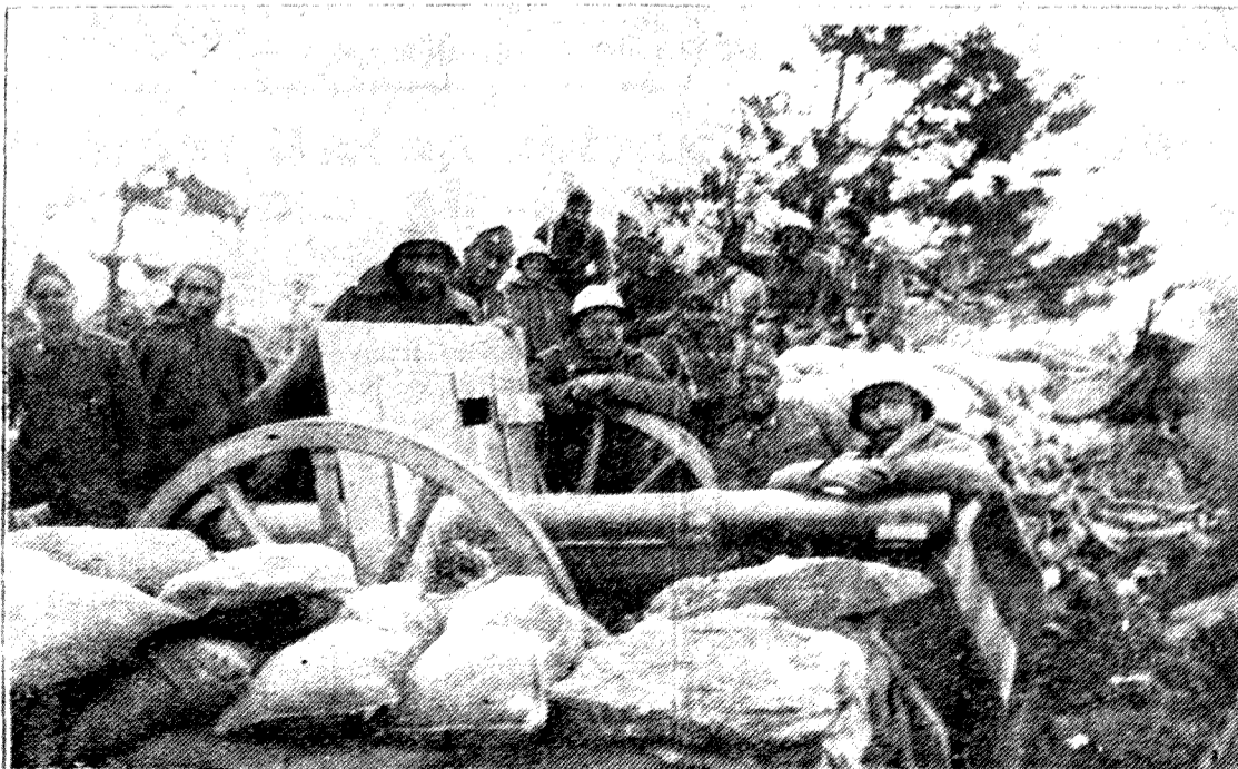
Echado sobre el cañón el soldado de España permanece ante el objetivo en la posición montañosa, siempre alegre, a pesar de los sin sabores de la guerra

Una Patria - Un Estado - Un Caudillo Una Patria: ESPAÑA - Un Caudillo: FRANCO