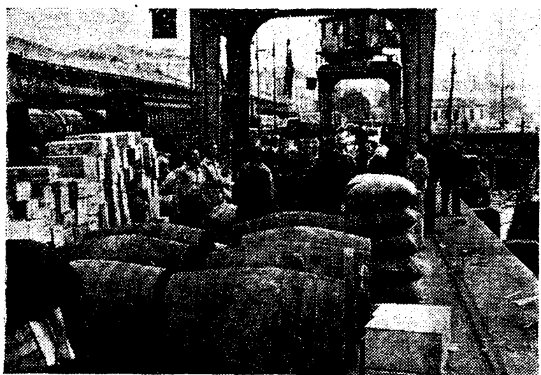
El general de Intendencia de Santander inspeccionando la llegada de víveres para la población al siguiente día de ser tomada la ciudad.