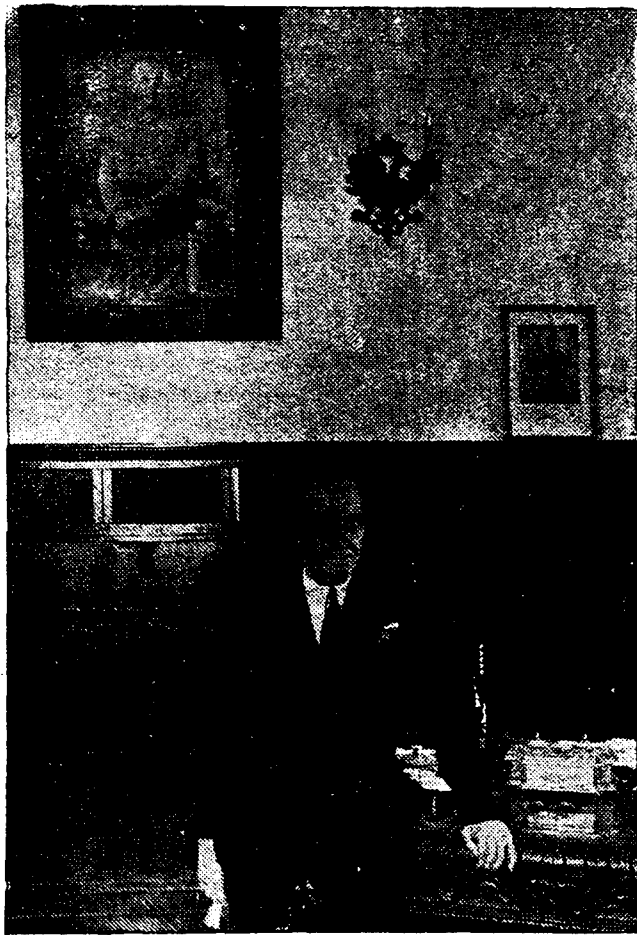
El señor gobernador civil en su despacho oficial