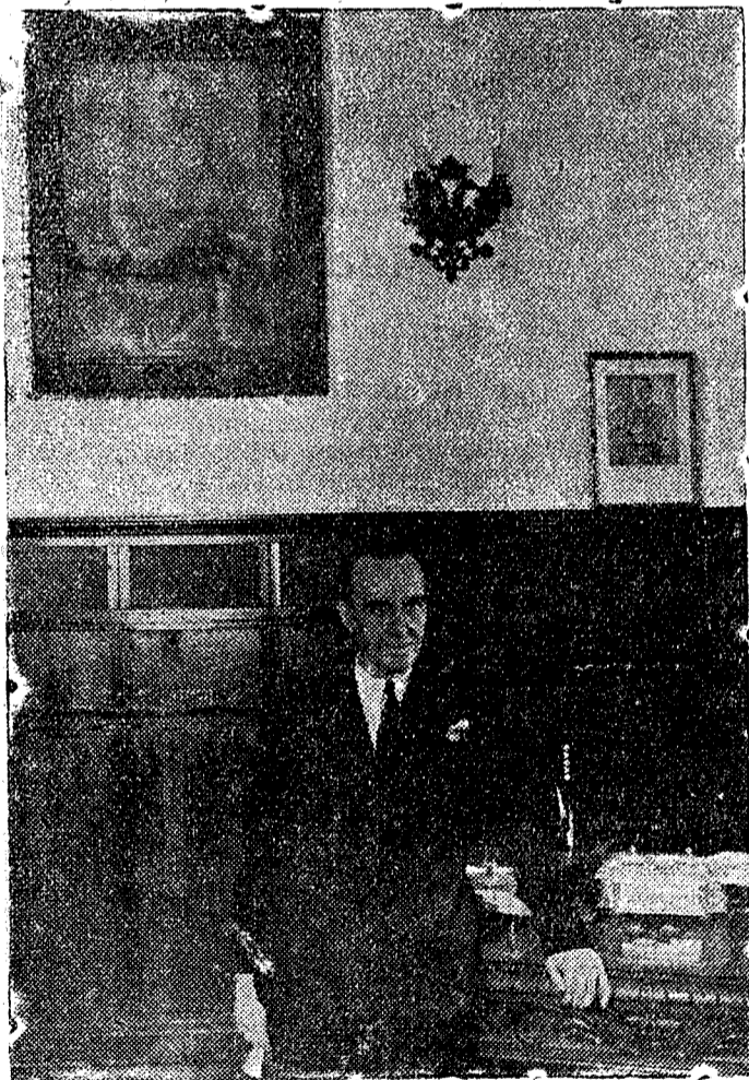
El señor gobernador civil en su despacho oficial