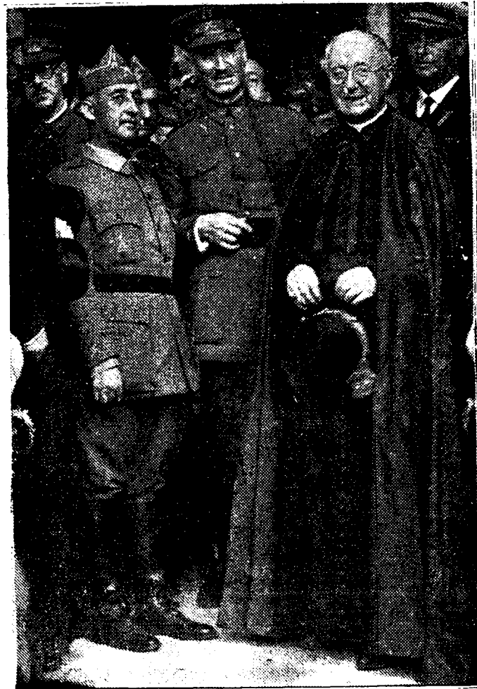
Pasado el 18 de julio ya empieza la efemérides a recordar, «hoy hace un año»

Durante la mañana, la flota aérea marxista no hizo su aparición. Hacia las doce, varios aparatos de bombardeo intentaron ametrallar las líneas nacionales. Funcionaron los antiaéreos y dos aparatos rojos, visiblemente tocados, se internaron en nuestro campo, yendo a caer al Sur de Boadilla, en terrenos próximos al campamento de Retamares.