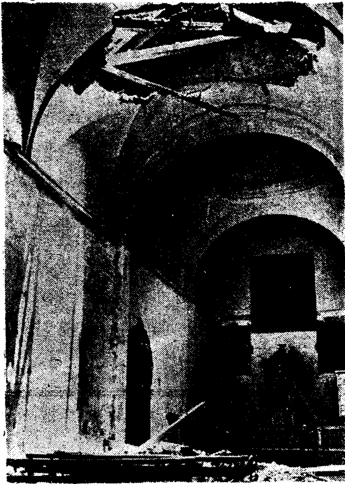
Por todos los caminos, el paso del marxismo es desolación y ruina. Su obra destructora va marcando con indelibles señales todo el suelo de nuestra Patria. He aquí una iglesita montañesa saqueada primero, y cañoneada más tarde por las hordas rojas