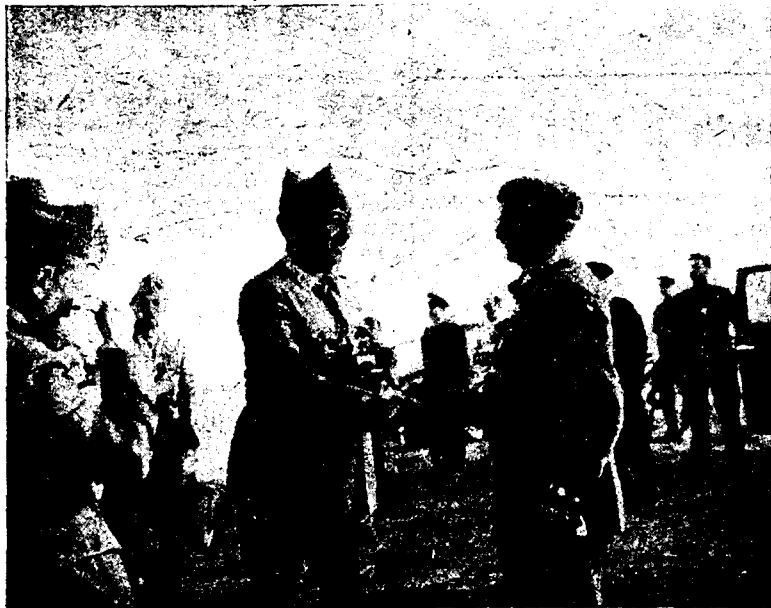
El Generalísimo ha dirigido personalmente las brillantísimas operaciones que han dado como resultado la caída de Santander. He aquí a nuestro Caudillo felicitando al coronel Vigón por las actuaciones de las columnas que dirige

Salamanca.—El Consejero de Economía de la Generalidad, ha hecho unas declaraciones indicando que continuará la campaña contra la propiedad privada.