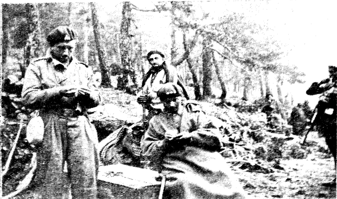
Posiciones avanzadas... Tras la dura lucha con el enemigo, el descanso es el más confortador. Es la hora cordial de la camaradería jaranera, de las cartas familiares, de las evocaciones del terruño y del hogar. El «boina roja», se abstrae en el recuerdo de una bella «Margarita», que allá en la retaguardia labora también afanosamente por Dios y por España...

Lisboa.—Un enviado especial de un periódico inglés en Barcelona comunica se está habilitando en esta ciudad un suntuoso edificio para que se instale en él el Gobierno ruso de Valencia presidido por Largo Caballero.