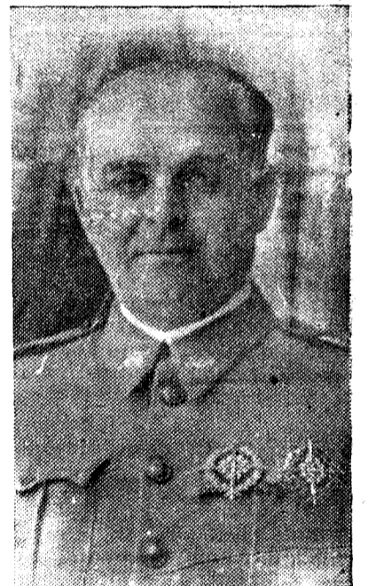
Quando Segovia fué objeto de la codicia marxista, el ilustre general Várela con sus ejércitos, fué protector de aquella ciudad, que hoy agradecida premia con el título de hijo adoptivo de la misma al sabio y valeroso militar.

El estrépito de nuestros cañones y el empuje de nuestros bravos soldados les harán convencerse de que la guerra está definitivamente perdida para ellos. La resistencia que pueden ofrecer es desde luego completamente inútil.—(Faro).