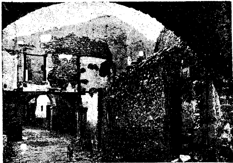
Potes, la simpática e industriosa villa montañesa, muestra en sus edificios señales inequívocas del paso de la horda roja. La dinamita ha deshecho numerosos edificios.

Leganés, 1 (noche). — Especial para EL ALCÁZAR, por María Bueno Núñez de Prado.—Anoche los rojuelos volvieron a iluminar el cielo con la luz de los reflectores, la maniobra fué espaciada y como preparando alguna cosa... que, ¡naturalmente!, intentaron realizar hoy, y... ¡como siempre, les salió fallida! ¡Son unos artillerazos magníficos! Seguramente su radio va a anunciar hoy una rené de triunfos y de aciertos, que, afortunadamente, no han existido más que en la fantasía marxista, y lo triste para ellos y venturoso para nosotros, es que esa fantasía no deja nunca de causarles disgustos, cuando no menos quebrantos. Hoy tengo que referir uno fresquito, chistoso, como todo lo que se refiere a la pobre facundia de los rojuelos: Atacaron anteanoche una posición de nuestras avanzadillas, y nuestros soldados, como siempre,