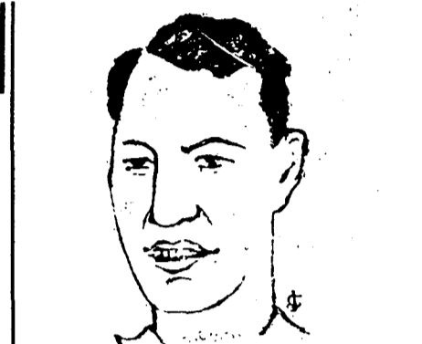
Lángara, el resucitado, que en breve llegará a Bilbao, y a quien se le considera como el delantero centro de la selección española que se enfrentará con la portuguesa.

Don Jenaro de La Riva, uno de los directivos de la Nacional, ha relatado los grandes proyectos que se llevarán a cabo en el fútbol es