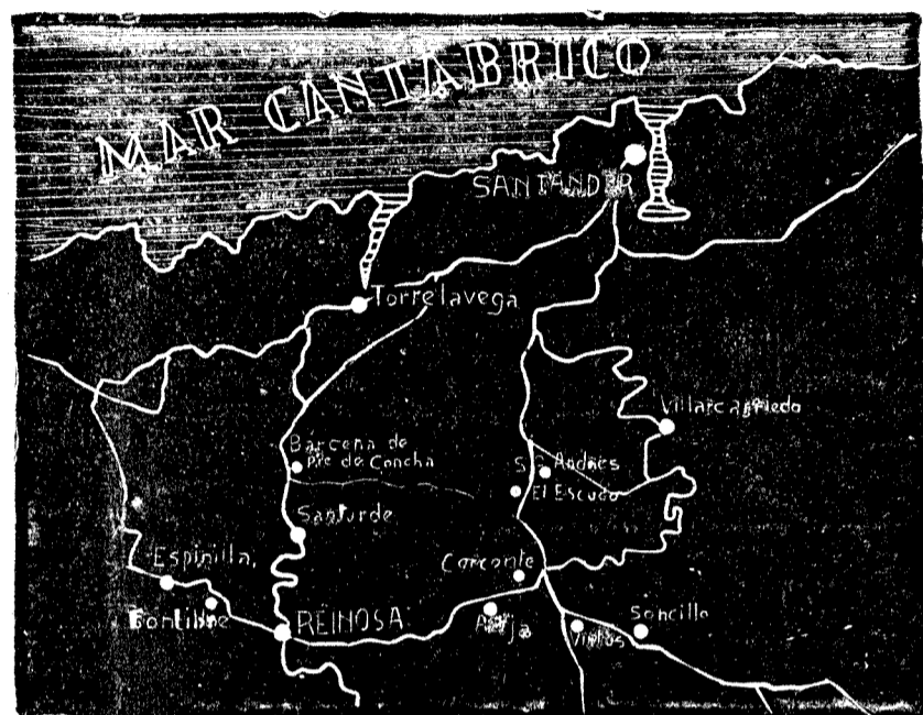
El grandioso avance por el frente de Santander se encuentra bien elocuente en el presente gráfico. Nuestras fuerzas han pasado por un lado el puerto del Escudo y por la carretera de Torreavega el importante pueblo de Bárcena de Pie de Concha