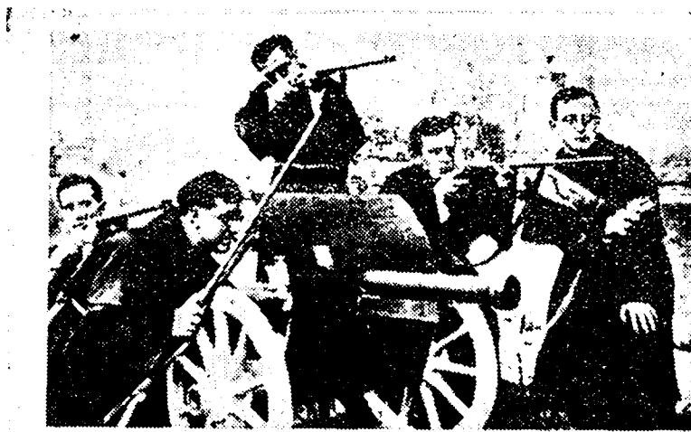
This photograph probably taken during the preparation of the fascist patch has been found among other incriminating documents, in the course of a search in the Madrid palace of Count of Vellellano, financier, one of the rebel plotters.

Las palabras, el llamamiento de Julius Deutch sobrevienen en un momento en que Inglaterra y Francia van a ser llamadas a contestar a la nota italiana.