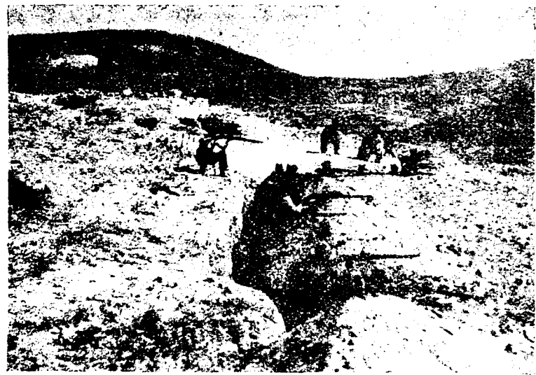
Frente de Extremadura. Los rojos sintieron enormemente que Peñarroya cayese en nuestro Poder. Sus minas los agradan y su situación les favorece. Desde que nuestros soldados ganaron la ciudad y montañas para España, un día sí y otro no intentan rescatarla. Vano empeño. Las tropas de Franco están firmes y no darán un paso atrás.

¿Sí, sí, jamones...! ¿Lentajas mezcladas con algarrobas!... ¿Y a qué precios!... Los jamones y los langostinos son para los cabecillas obreristas. Naturalmente. ¿Es que puede haberlos para todos? ¿Pues eso es lo que decíamos los contrarrevolucionarios! Y tú, miliciano Remigio, corre que erre. ¡Idiota!