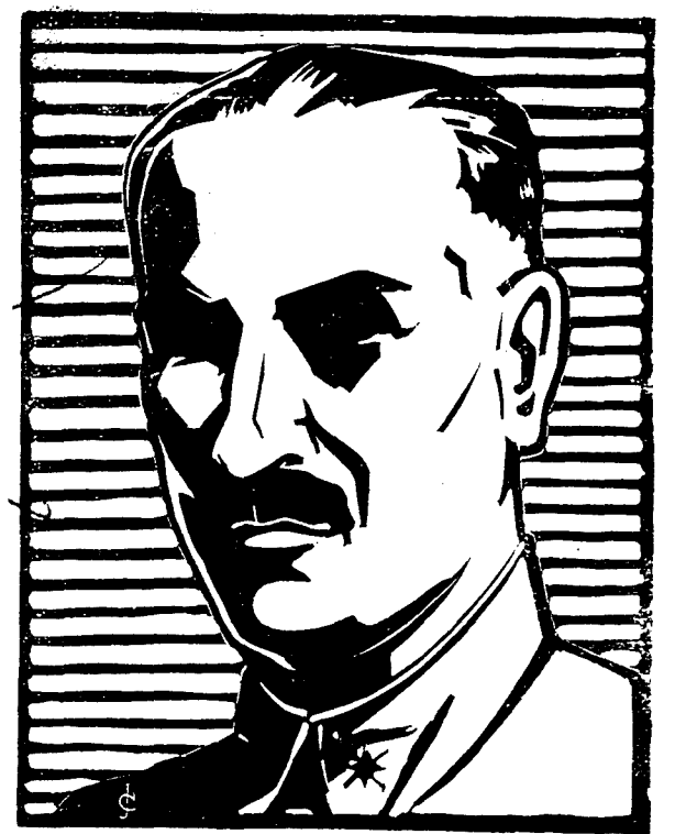
Don Gonzalo Queipo de Llano, el general locutor, a quien las radios de España le van a dedicar un homenaje

Las jornadas van sucediéndose conforme a los dictados de nuestros Mandos. Los marxistas de Madrid, que saben lo que para ellos significa el fracaso de esta ofensiva, quieren disimularla con palabras que a nadie convencen.