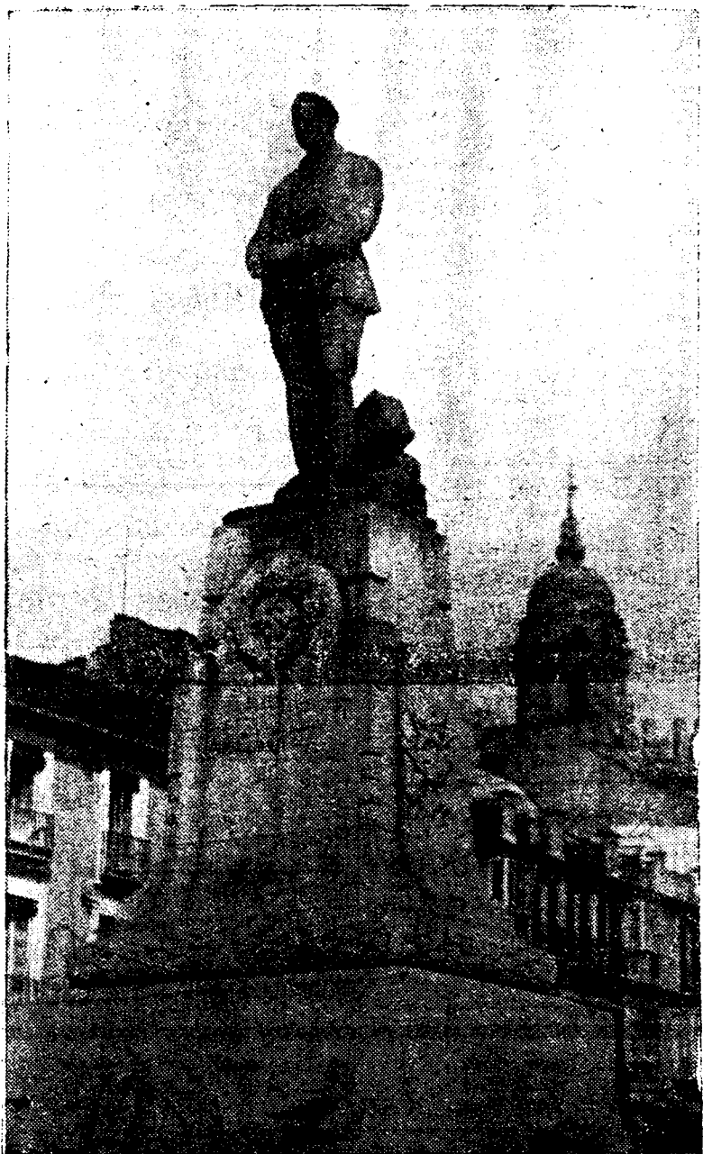
Al entrar las tropas victoriosas en la ciudad de Málaga, apareció, cubierto con la boina roja, la estatua del comandante Benítez (muerto gloriosamente en Africa) (Foto Gelan).

Los rojos han sufrido tres mil bajas en el sector de Guadalajara