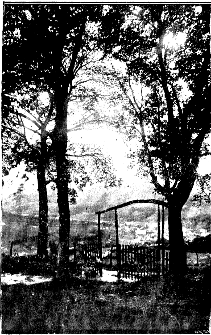
Málaga y Granada; y entre Granada y Málaga esos campos andaluces y esas sierras con pueblos blancos en los valles y casitas como ermitas en las cumbres blancas...

LOS AVIONES ROJOS BOMBARDEAN A LA POBLACIÓN CIVIL, SIN SEÑALAR ZONAS DE REFUGIO. ¿NO CUENTAN ESTO A LAS COMISIONES EXTRANJERAS QUE INVITAN?