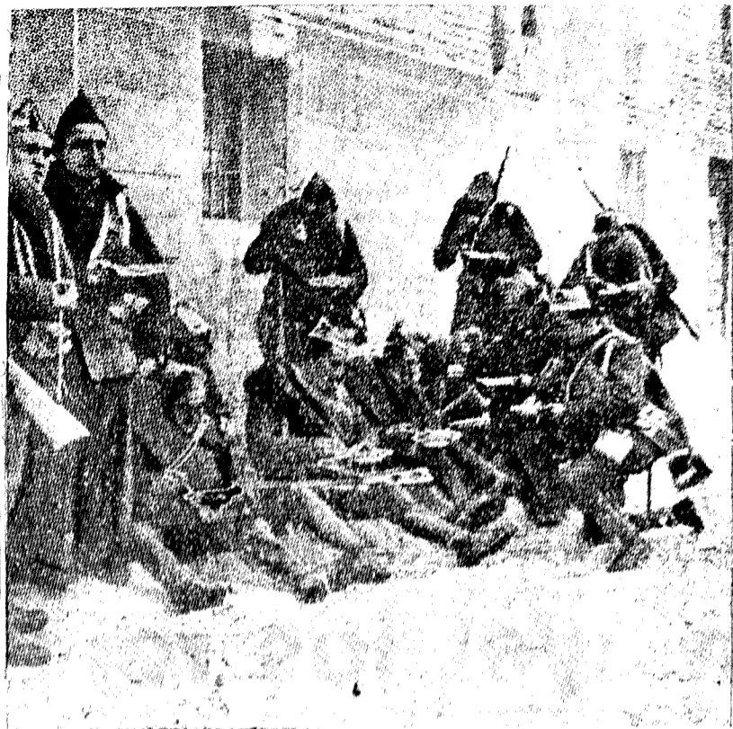
Un momento agradable en la campaña... La hora del rancho... Nuestros valerosos soldados, sin cumplidos, casi sobre la marcha, pero con excelente apetito, reparan sus fuerzas para proseguir la jornada del día en la lucha heroica de España