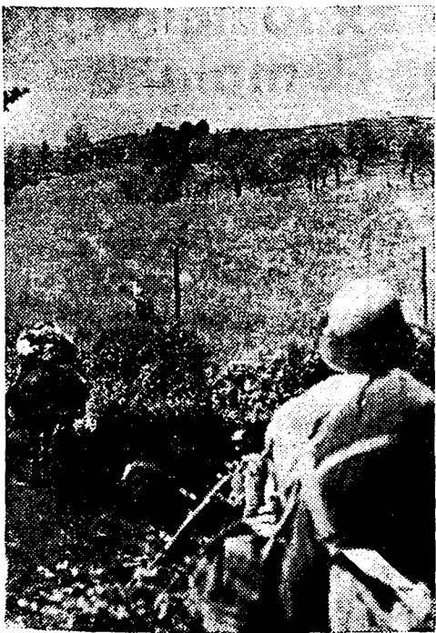
Avanzan las tropas españolas por las tierras onduladas de La Montaña. En sus más altas cumbres no tardará en ondear la bandera de España

Salamanca, 14 de Julio de 1937.— De orden de S. E. el Generalísimo, el general de Estado Mayor, Francisco Martín Moreno.