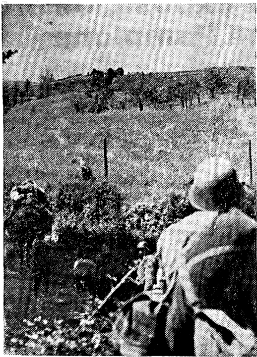
Avanzan las tropas españolas por las tierras onduladas de La Montaña. En sus más altas cumbres no tardará en ondear la bandera de España

Salamanca, 14 de Julio de 1937.—De orden de S. E. el Generalísimo, el general de Estado Mayor, Francisco Martín Moreno.