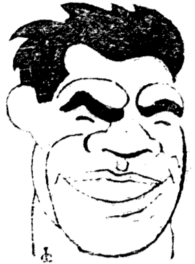
Paulino Uzcudun, que el próximo domingo luchará en Zaragoza; cuyos ingresos van destinados a la Suscripción Nacional.