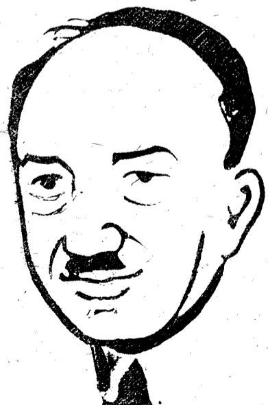
Delbos, el ministro de Ne- gocios Extranjeros francés cuyo desdichado viaje a los países centroeuropeos está teniendo la repulsa de las principales cancillerías, que ven en el eje Roma-Berlín la seguridad de los intereses de la paz

Es decir, que la comedia ginebrina toca a su fin. Y que habrá de hacerse una política Internacional más clara e imparcial, o correrá peligro el registro en que ve- ña desenvolviéndose el an- tiguo cacicazgo aliado.