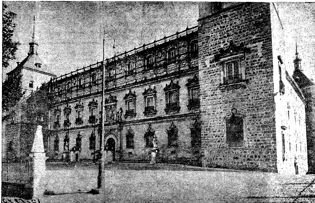
La fachada principal del Alcázar, cuya gran portada, magnífica joya arquitectónica de Covarrubias, comenzó por estos días a sentir los efectos de los disparos de la artillería roja, que se prodigaba incautamente contra aquel pedazo de España

Deberán hacerse en momento oportuno estadísticas oficiales completas de los mártires de la capital y de la provincia para que, mediante cuadros o lapidas en el Ayuntamiento y en la Diputación, queden constancia y recuerdo eternos de todos esos nombres sagrados para Toledo y para España. Deberían también dichas entidades, sin perjuicio de los homenajes que en su día precedan, celebrar, antes de terminar los aniversarios, funerales solemnes por esas víctimas, como tributo colectivo y oficial, y porque no todas las familias podrán dedicar sufragios a los suyos.