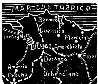
Gráfico de las operaciones decisivas sobre Bilbao. Las flechas indican los puntos por donde ha sido roto por las fuerzas nacionales el famoso cinturón de hierro

Hasta Bilbao ya no queda más obstáculo que los montes de Archanda y Santo Domingo; es decir, los auténticos arrabales de Bilbao, a cuyo cementerio de Derio han debido a estas horas llegar nuestras vanguardias.