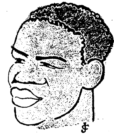
Joe Lois, que el próximo día 22 se enfrentará en Chicago con J. Braddock, campeón del mundo de todas las categorías, y que recientemente ha sido descalificado por la Comisión de Boxeo Neoyorquina.