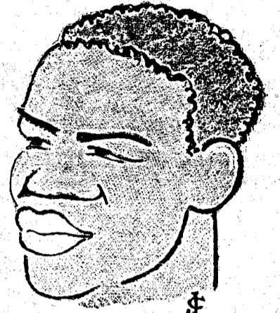
Joe Louis, que el próximo día 22 se enfrentará en Chicago con J. Braddock, campeón del mundo de todas las categorías, y que recientemente ha sido descalificado por la Comisión de Boxeo Neoyorquina.

Van a comenzar a jugarse los encuentros de la Copa Davis (zona europea). Los partidos Italia-Alemania tienen lugar en Milán y los encuentros Francia-Checoslovaquia, en Praga. Los franceses se muestran bastante temerosos ante la valía de los checos.