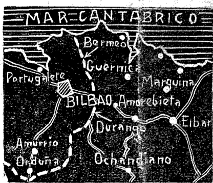
Gráfico de las operaciones decisivas sobre Bilbao. Las flechas indican los puntos por donde ha sido roto por las fuerzas nacionales el famoso cinturón de hierro

El señor Anastasio... (De Gracia tiene poca; ni física, ni moral). Nombre, tipo y cara de zapatero. Presidente de la U. G. T. Es decir: uno de esos "listos", de la Casa de Pueblo, elevados, a fuerza de pilterías, a cacique de los obreros y mangoneador de la política española. Fué diputado por Toledo (Toledo tiene esta nota triste en su Historia) y comisario del Canal de Isabel II. Ya entonces no se le llamaba a este magno enchufe "comisario regio", pero si era "regio", el automóvil oficial que disfrutaba. Al mismo tiempo, gozaba de otros grandes enchufes sindicales y oficiales. Y los obreros, en la higuera entonces, como ahora en el campo rojo, donsiguen en la higuera y en las trincheras.