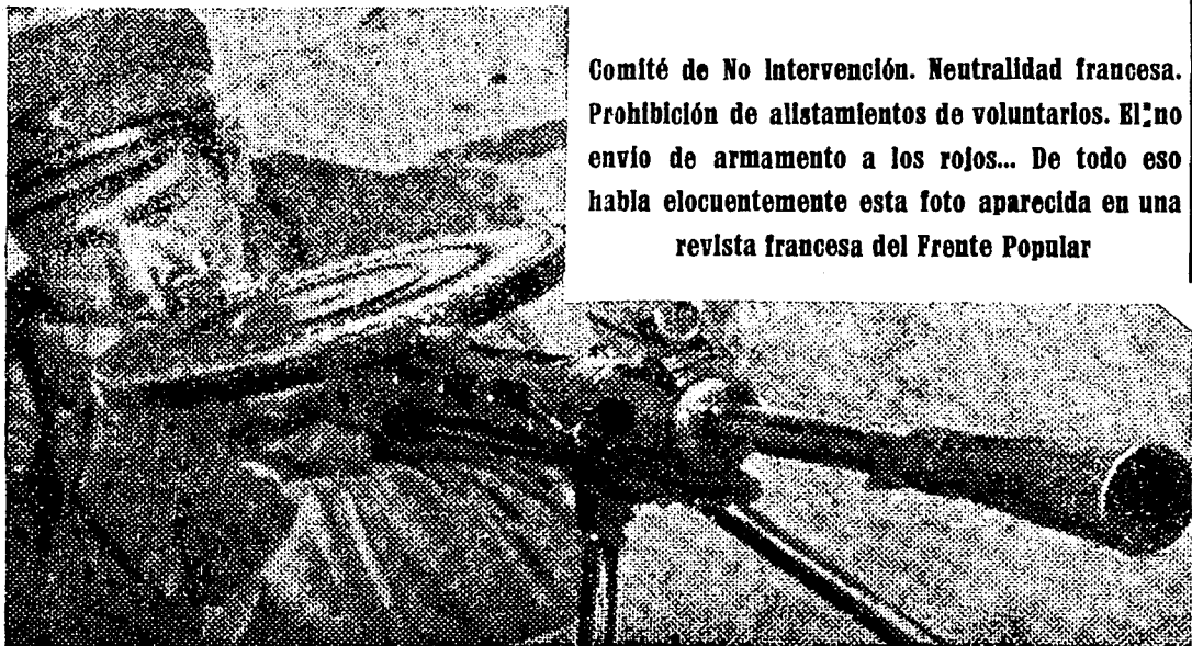
Comité de No Intervención. Neutralidad francesa. Prohibición de alistamientos de voluntarios. El no envío de armamento a los rojos... De todo eso habla elocuentemente esta foto aparecida en una revista francesa del Frente Popular

Lisboa, 12.—Comunican de París que en el próximo Consejo de Ministros se estudiará un proyecto del ministro de Negocios Extranjeros, autorizando al Gobierno francés para dictar medidas prohibitivas del envío de material de guerra y voluntarios a los frentes españoles. Radio Club Português, comentando esta noticia, dice que haya razones más que suficientes para dudar de la sinceridad de tal decisión.