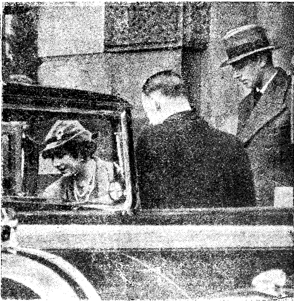
Mrs. Simpson, la prometida del duque de Windsor, cuya boda se anuncia para el próximo mayo en Viena