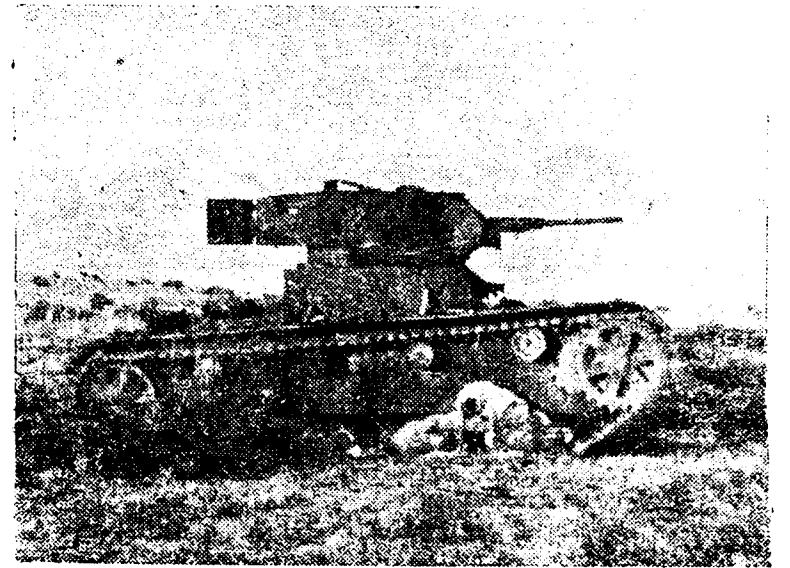
En el frente de Peñarroya los rojos dejaron abandonado, después de los últimos ataques, este tanque. En su parte inferior pueden verse los efectos del incendio que lo inutilizó.

Los soldados de Franco asombran así al mundo por sus cualidades heroicas de tenacidad y valor.—Incógnitas.