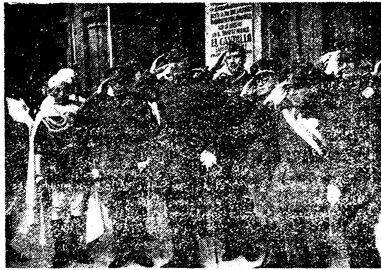
Destacadas autoridades militares del nuevo Estado saludan al paso de nuestro Caudillo el Generalísimo Franco, en la Plaza Mayor de Salamanca.