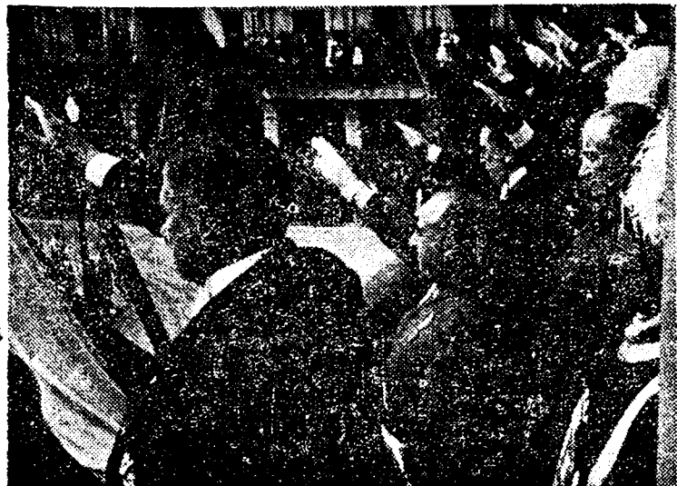
El Generalísimo, acompañado del General Queipo de Llano y el Embajador alemán, saludan a la multitud que les aclama con motivo de la presentación de credenciales del representante del Führer.