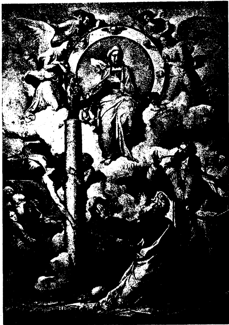
Santiago, apóstol. Virgen del Pilar. España. Tres nombres unidos en una sola fecha: 12 de octubre. Y por si fuera poco honor, por si hubiera alguna duda respecto al simbolismo de esta sublime aparición, en ese mismo número del calendario inmortal de nuestra Raza un nuevo signo una nueva piedra blanca: el descubrimiento de América. Cuatro nombres gloriosos en una sola fecha. Dijérase que Dios quiso expresar en el 12 de octubre su amor y estimación a nuestra Patria.