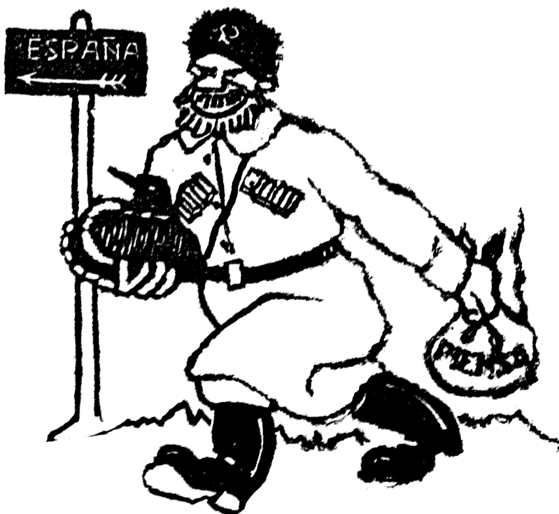
HISTORIA DE UN TANQUE