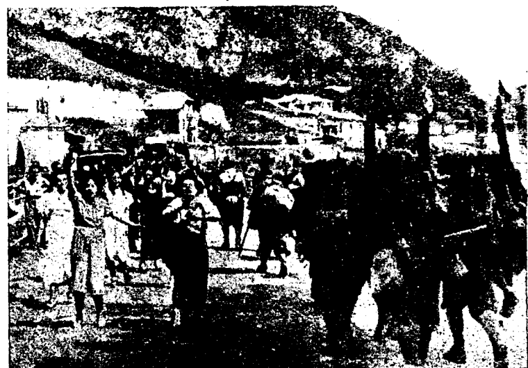
Llegan las primeras tropas nacionales a Santander. La población, juventud ansiosa de auras españolas, sale gozosa y sonriente, al paso de los gloriosos vencedores.

Yo he podido comprobar la fe casi religiosa que tienen nuestros