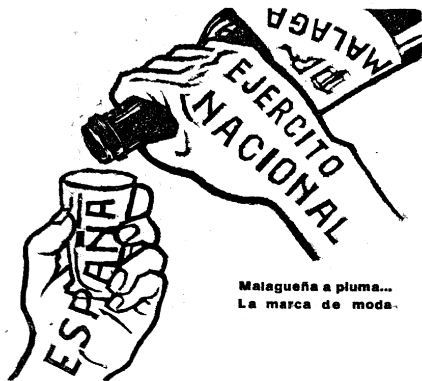
Malagueña a pluma... La marca de moda.

Otro periódico inglés manifiesta que, en el curso de las operaciones, la toma de Málaga tiene una importancia formidable, pues en lo sucesivo el puerto de Málaga será base de concentraciones de la escuadra nacional para atacar Valencia y otros puertos de Levante.