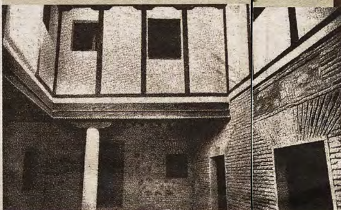
Patio principal del edificio de la Santa Hermandad recién restaurado en 1958