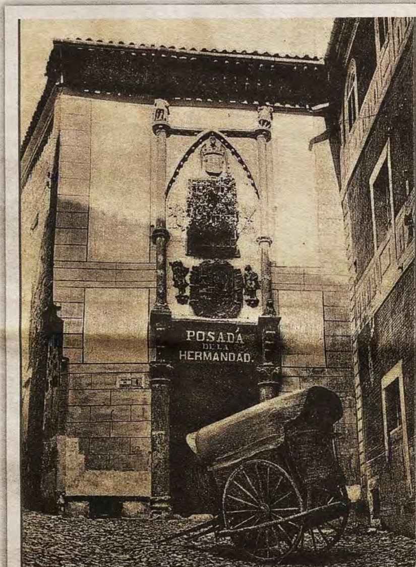
Carro ante la Posada de la Hermandad en una postal de Constantino Garcés a principios del siglo XX.