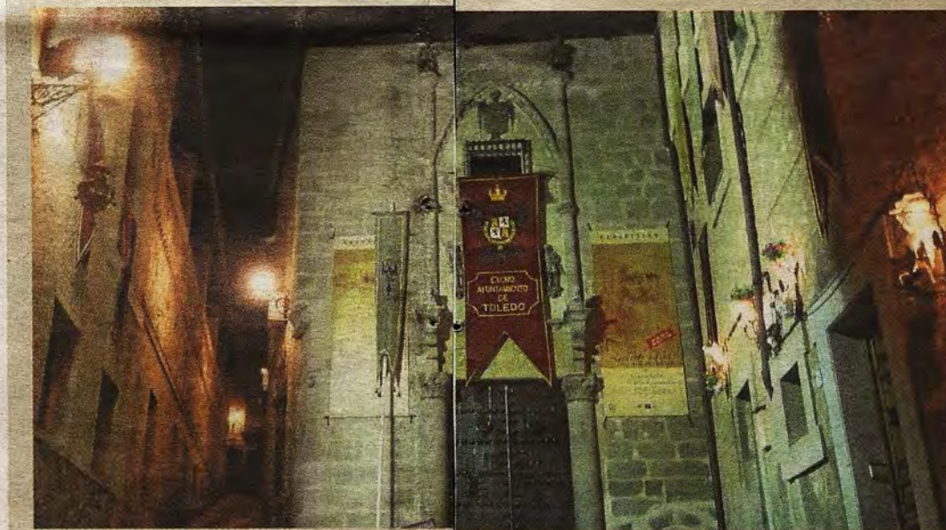
Aspecto nocturno de la Posada de la Hermandad en mayo de 2013