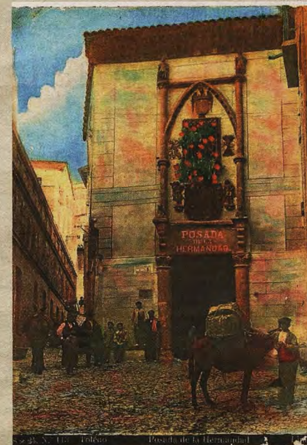
Fachada de la Posada de la Hermandad en una postal coloreada de Abelardo Linares hacia 1915. Colección Archivo Municipal de Toledo

alguna asociación cultural. Del antiguo «Museo histórico de la Ciudad», tras devolverse todos sus fondos al Archivo Municipal, solo queda la Guía de don Clemente Palencia. Ahora, la parte antigua del edificio de la Hermandad -sus calabozos, suelos empedrados y austeras habitaciones-, es un escenario temático que ha ido albergando muestras temporales con réplicas de armas, aperos de gladiadores, huellas del mundo templario, inventos leonardescos o copias de máquinas de guerra hasta lo que depare el futuro.