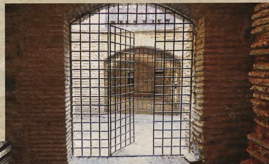
RAFAEL DEL CERRO