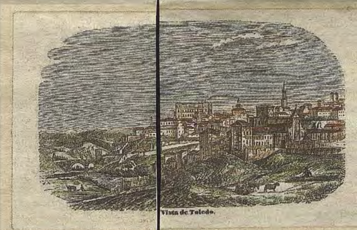
Grabado con el convento de Trinitarios (s. XIX) cercano a San Lázaro.