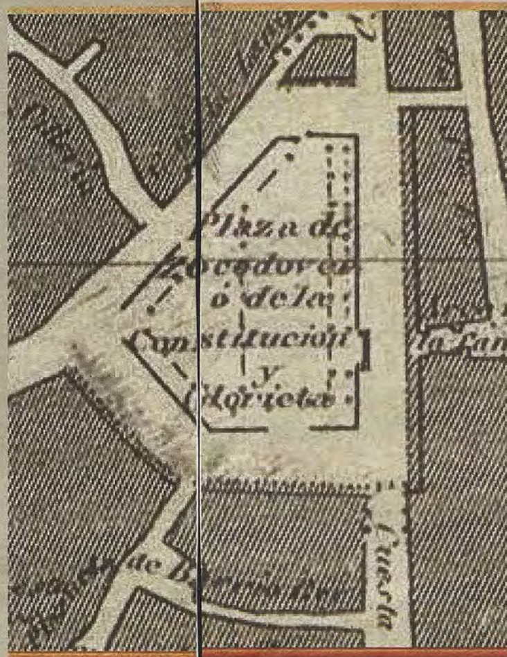
Plaza de Zocodover en el plano de Coello-Hijón (1858) con la glorieta concluida en 1840.