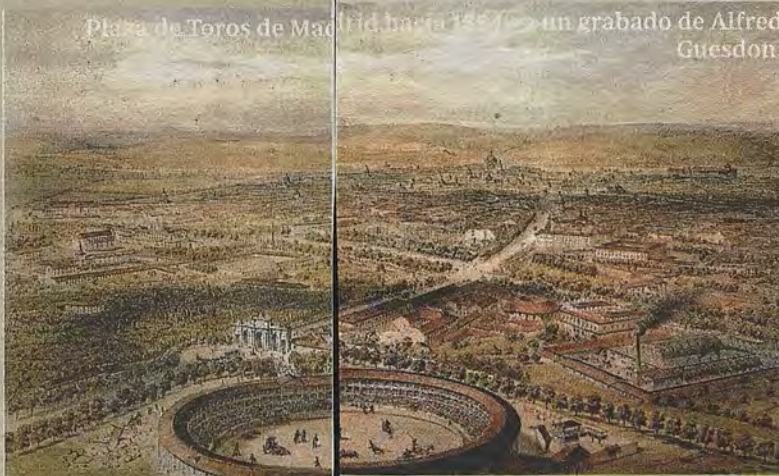
Plaza de Toros de Madrid hacia 1847, un grabado de Alfred Guesdon.