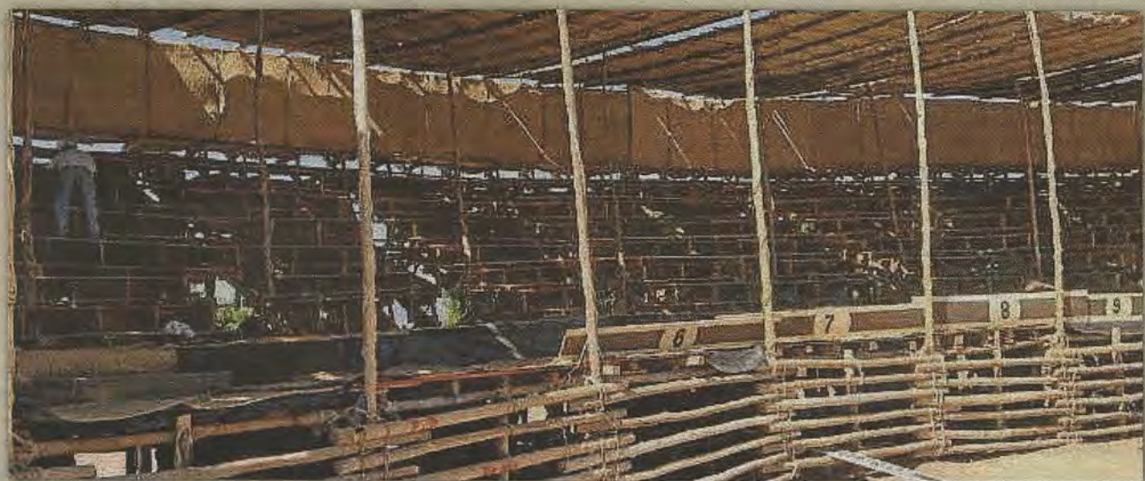
«La Petatera», plaza de madera en Villa de Álvarez que desde el siglo XVII se levanta cada año en el mes de febrero para 5.000 espectadores. Declarada Patrimonio Cultural del estado mexicano de Colima en 2013.