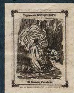
Ilustración sobre El Quijote en La Campana Gorda (11 de mayo de 1905)