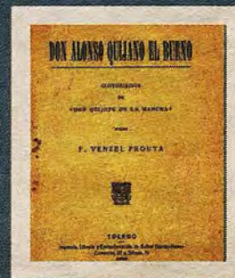
Don Alonso Quijano el Bueno (1922)