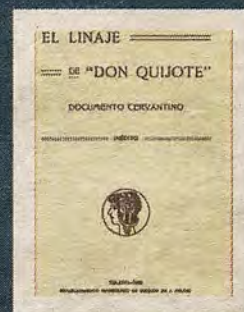
El linaje de Don Quijote (1922)

¿Quién era aquel sacerdote dramaturgo ocasional y devoto de Cervantes?